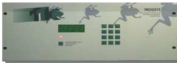
Version encastrable FG-SYS E, avec une face avant 19" sur une hauteur de 4U Largeur: 484 mm et hauteur: 176 mm