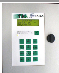
Coffret mural, type FG-SYS F Largeur: 200 mm, hauteur: 250 mm, profondeur: 100 mm