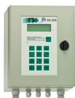
FG-SYS F 定位式检测单元（挂壁型） 长*宽*高=250mm*200mm*100mm